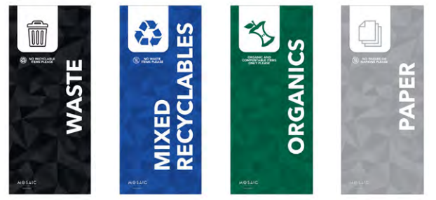
Las señales se almacenan en las versiones Narrow y Wide