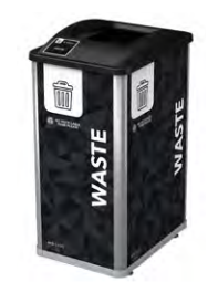
SENCILLO | 32G