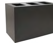
XL TRIPLE 84G