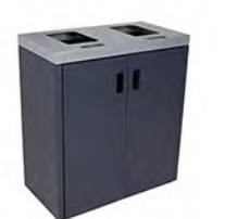
TAPA PLANA DOBLE