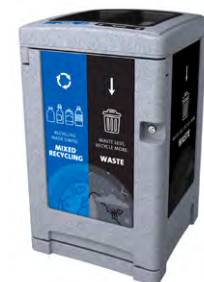
Greystone Indoor Double