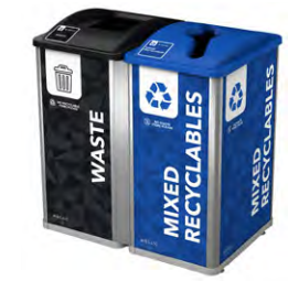
DOBLE | 64G