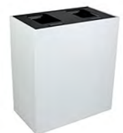
TAPA CON VISAGRA DOBLE