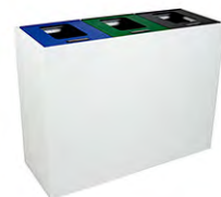
TAPA CON VARIAS VISAGRAS TRIPLE