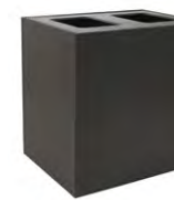
XL DOBLE 56G