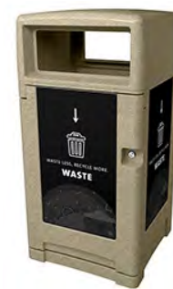
Sandstone Outdoor Single