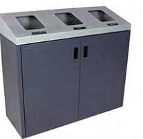
TAPA INCLINADA TRIPLE