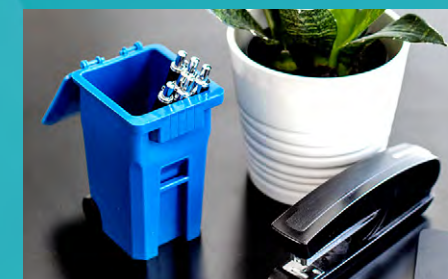
Mini Carretilla de Reciclaje