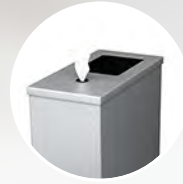
DESECHOS & TOALLITAS