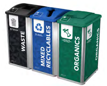
TRIPLE | 96G