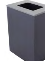
CUBO XL 32G *Disponible con Cenicero o Abertura Completa