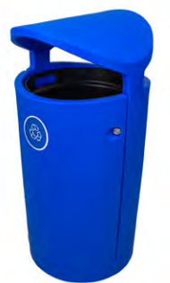
Sencillo - Azul